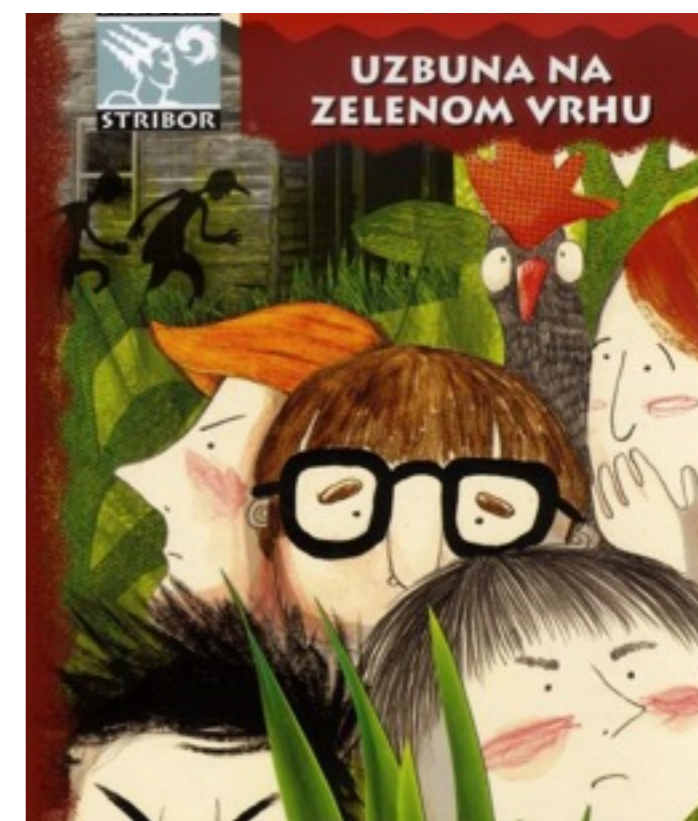
Neke od Kušanovih knjiga